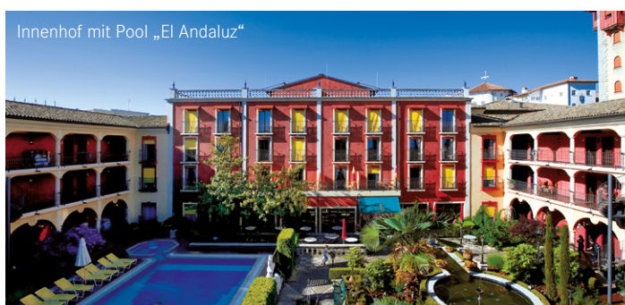
Innenhof mit Pool „El Andaluz“