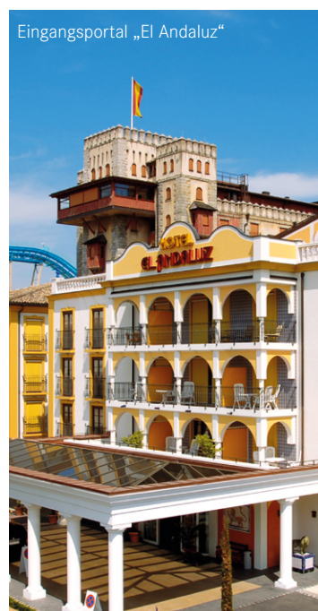
Eingangsportaal „El Andaluz“