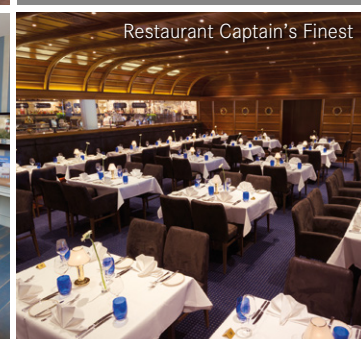
Restaurant Captain's Finest