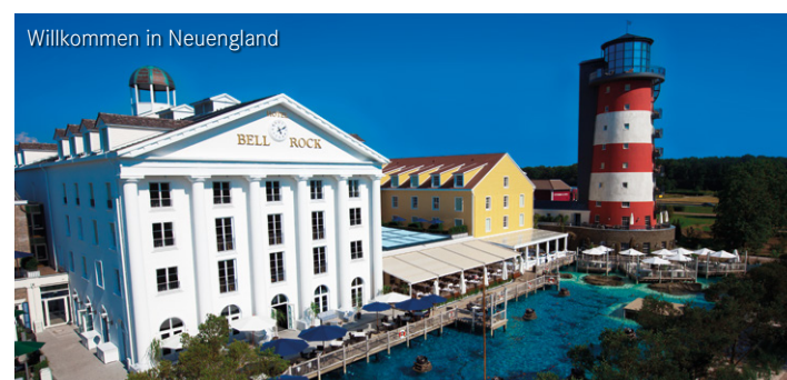
Willkommen in Neuengland