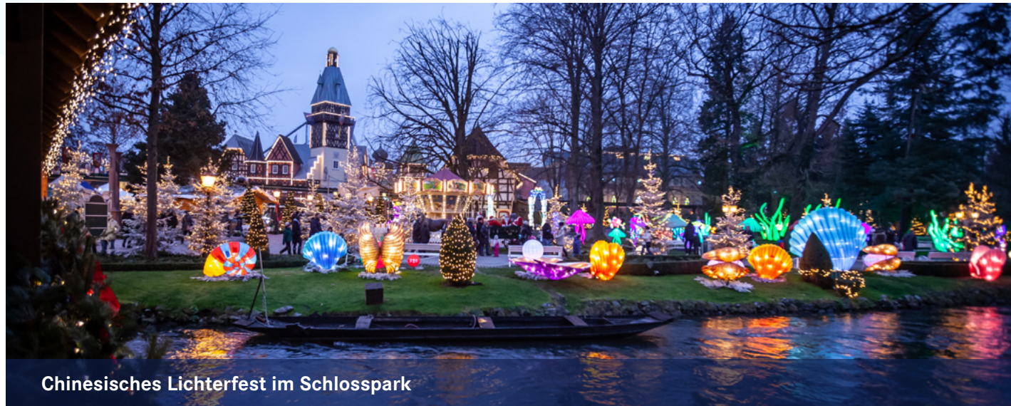
Chinesisches Lichterfest im Schlosspark